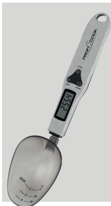
Návod LW 1214