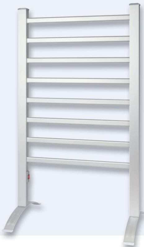
Elektrický ohrievač uterákov PC-EHW 3115