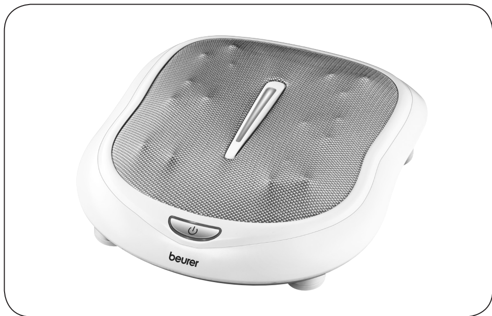
H Shiatsu talpmassírozó készülék Használati útmutató